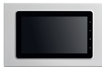
Bianco / White IP7120.50