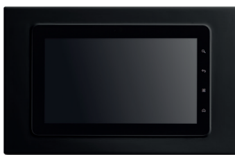
Nero / Black IP7120.40