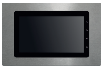
Acciaio Spazzolato / Brushed Steel IP7120.10